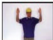
PERICOLO ALT o arresto di emergenza